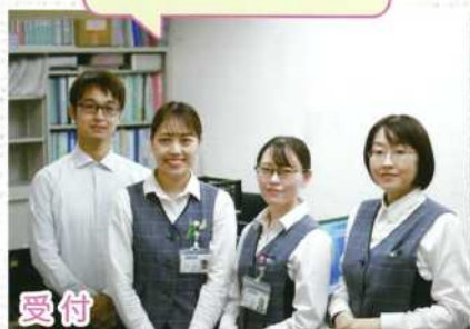
患者さま目線の対応を心掛けます。