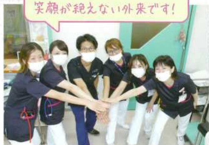
お困りの事や不安に思う事など 気軽に何でもご相談ください!