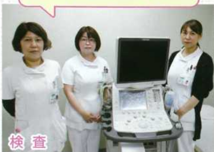
先生と協力して異常の早期発見に努めます!