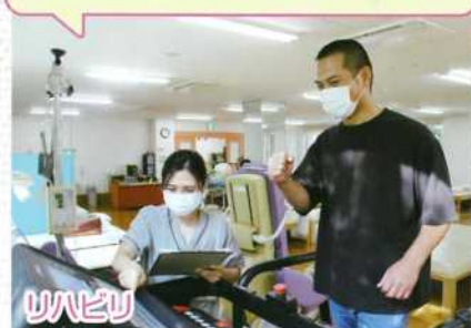
各種リハビリ器具も充実しています! 送迎バスの利用もできます!